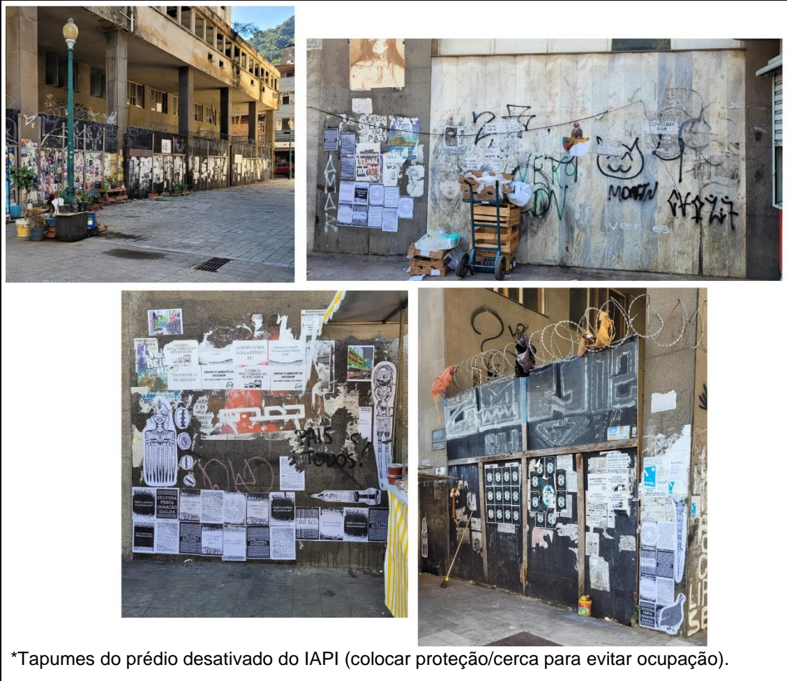
*Tapumes do prédio desativado do IAPI (colocar proteção/cerca para evitar ocupação).