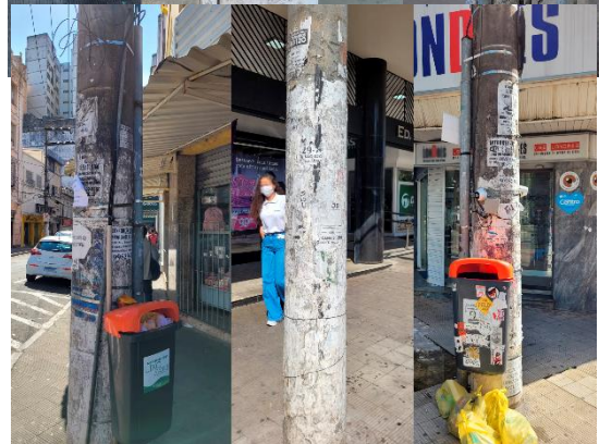
*Postes sem pintura, poluído de lambe-lambe e lixeiras danificadas.