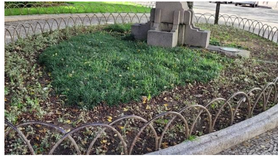
*Falta de paisagismo Praça Costa Pereira.