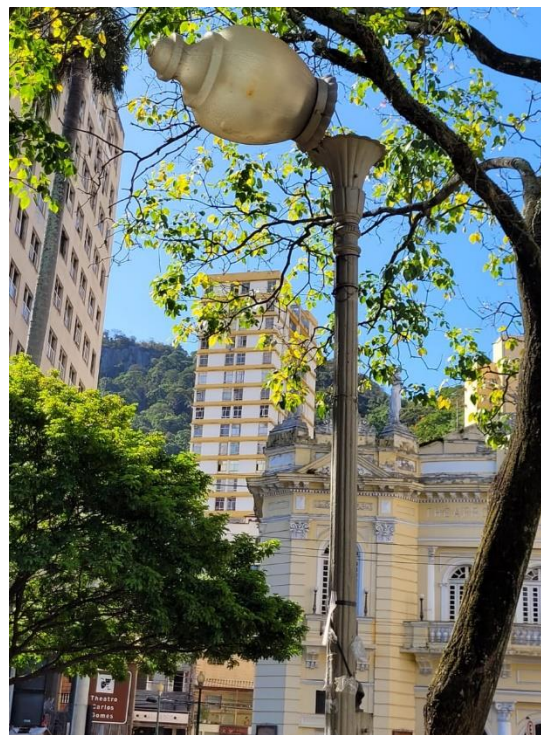
*Luminária danificada Praça Costa Pereira.