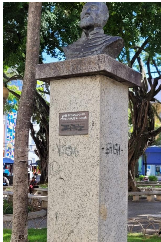
*Pichações em monumentos históricos.