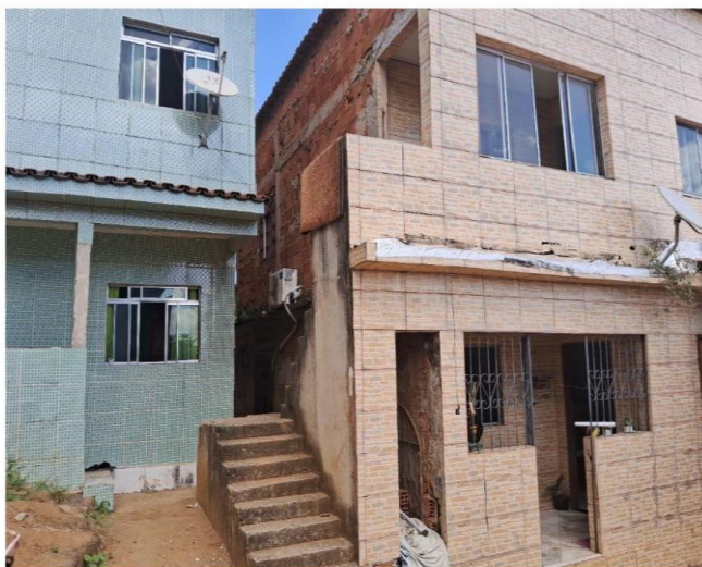
Imagem 1: Vista frontal dos imóveis da Sra. Divina, à esquerda, e da Sra. Kayncra, à direita.