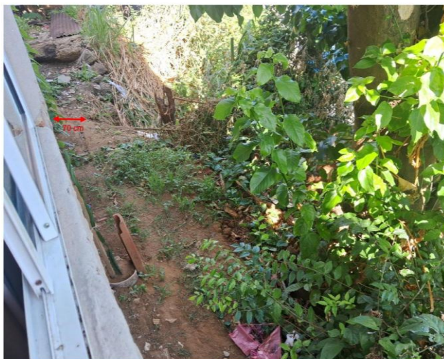
Imagem 2: Avanço de processo erosivo em direção à base da residência da Sra. Kayncra (fundos).