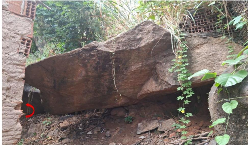
Imagem 9: Fundos da residência da Sra. Maracy.