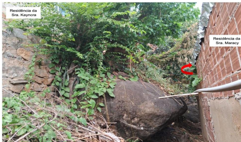
Imagem 10: Fundos da residência da Sra. Maracy.