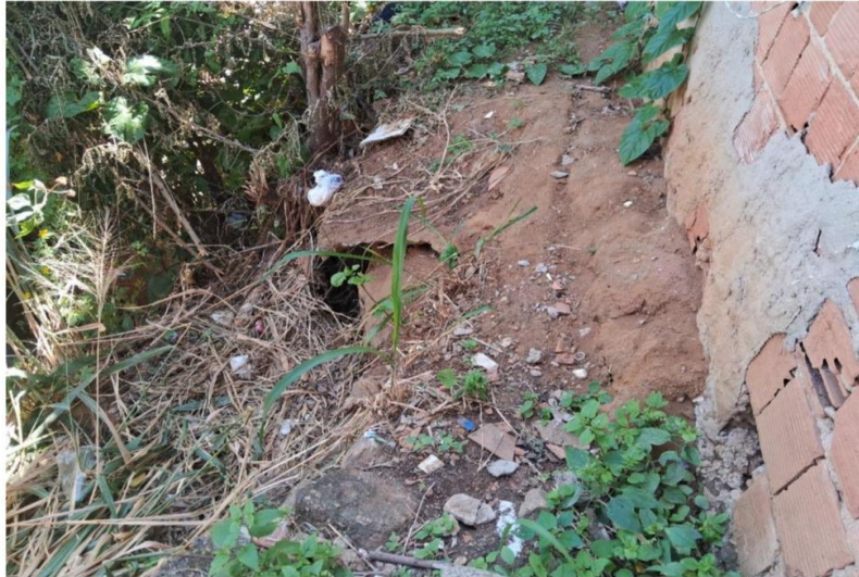
Imagem 3: Crista do talude próximo à residência da Sra. Kayncra.