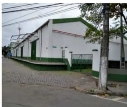
Galpões do IBC, em Jardim da Penha.